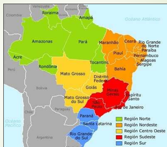
Carte du Brésil et des états fédérés