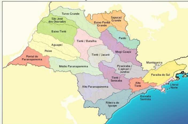
Comitês de Bacia Hidrográfica do estado de São Paulo